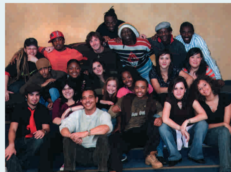
Mitglieder des One World Chor