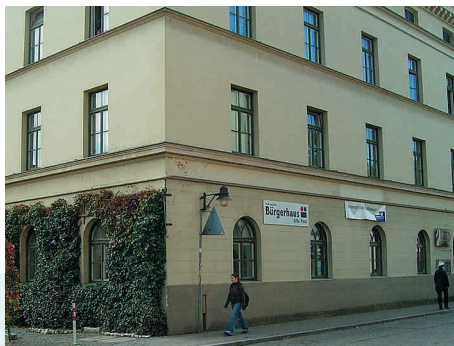
Die Alte Post

Ein ganz aktuelles generationenübergreifendes Projekt – EULE (Erleben, Unterrichten, Lernen) – ist erst kürzlich gestartet: Junge „Lehrerinnen“ und „Lehrer“ – aus den Abschlussklassen der Gymnasien – bieten Senioren ihre Kurse an. Dabei kann aktueller Unterrichtsstoff aus der Schule ebenso auf dem „Stundenplan“ stehen wie Schulungen im Umgang mit Computern und Handys. Umgekehrt geben SeniorInnen und Senioren im Erzählcafé im Bürgerhaus ihr Wissen und