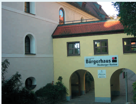
Der Neuburger Kasten